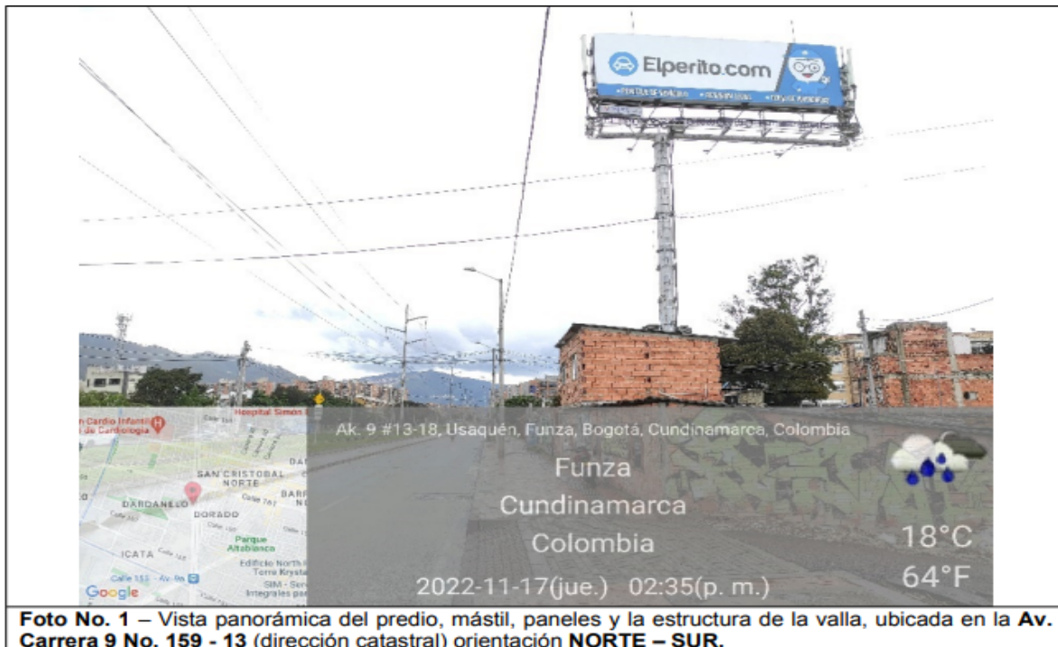
Foto No. 1 – Vista panorámica del predio, mástil, paneles y la estructura de la valla, ubicada en la Av. Carrera 9 No. 159 - 13 (dirección catastral) orientación NORTE – SUR .